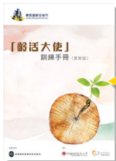
「齡活大使」 訓練手冊 (更新版)