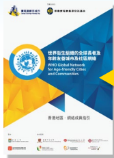
世界衛生組織的 全球長者及年齡 友善城市及社區網絡 - 香港地區網絡 成員指引